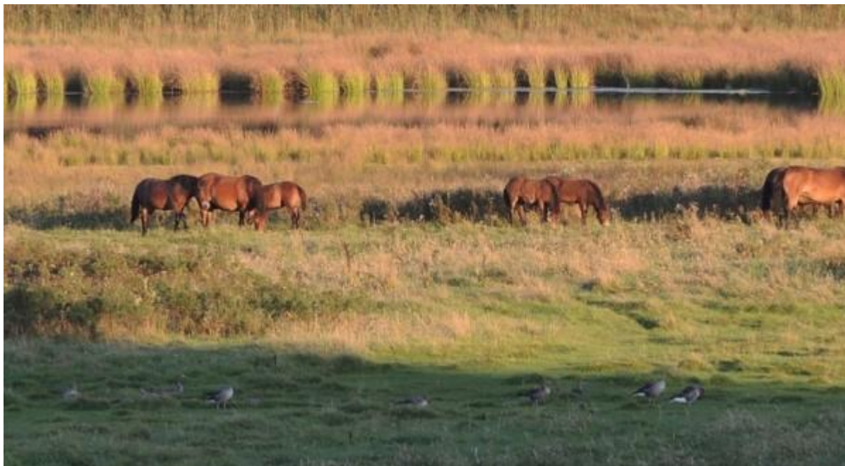
Eerst hadden we de paarden in het visier