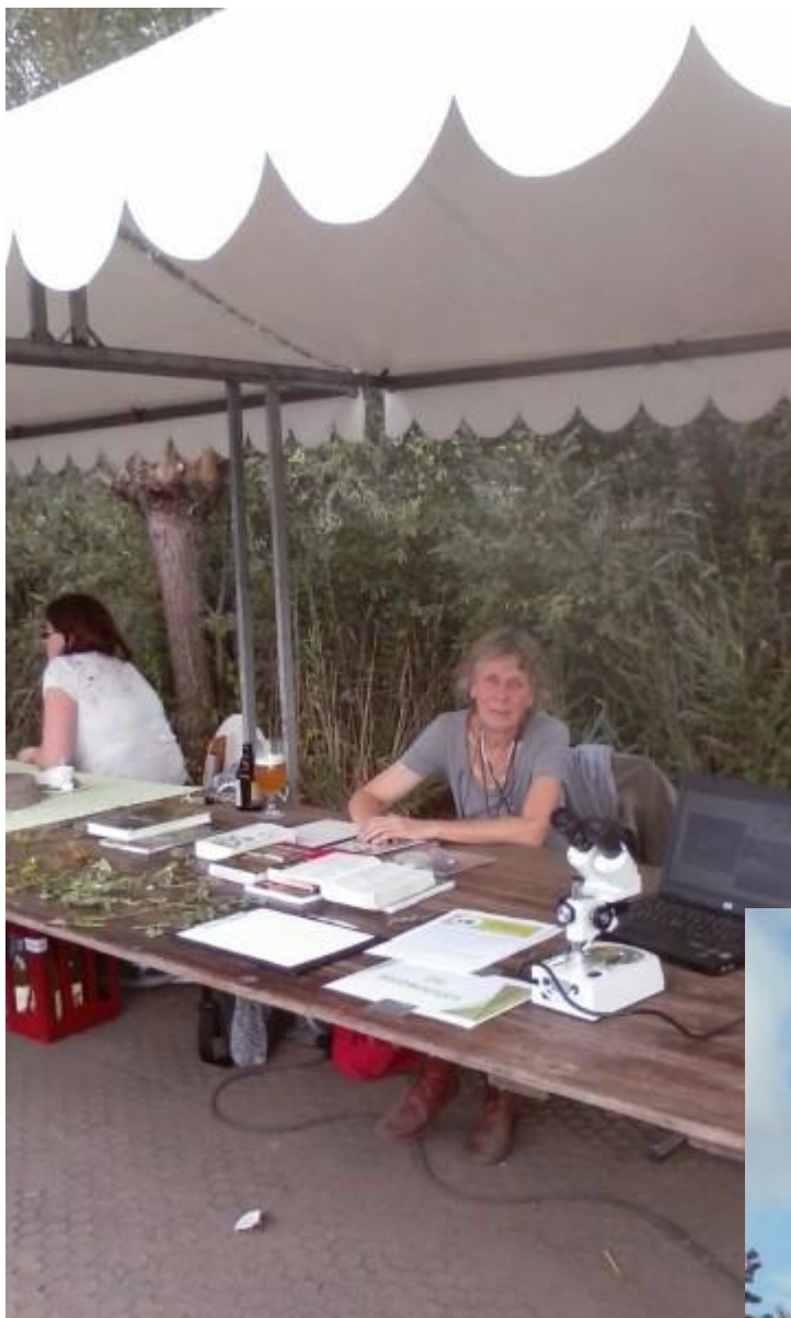
Op de hagevenhappening lieten we de bezoekers kennis maken met onze plantenwerkgroep