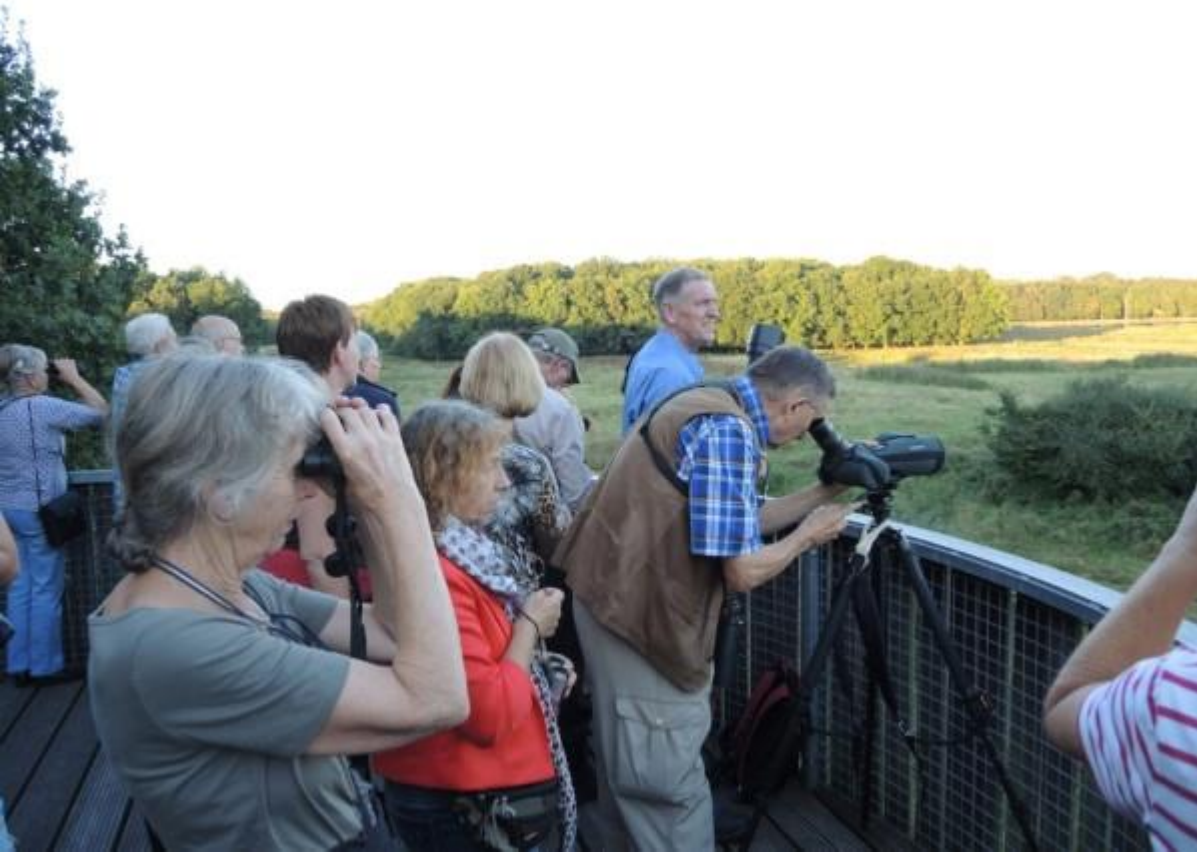
Na wat zoeken