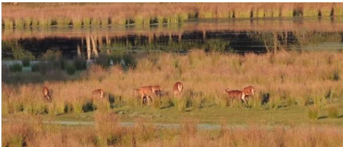
Wat verder de herten