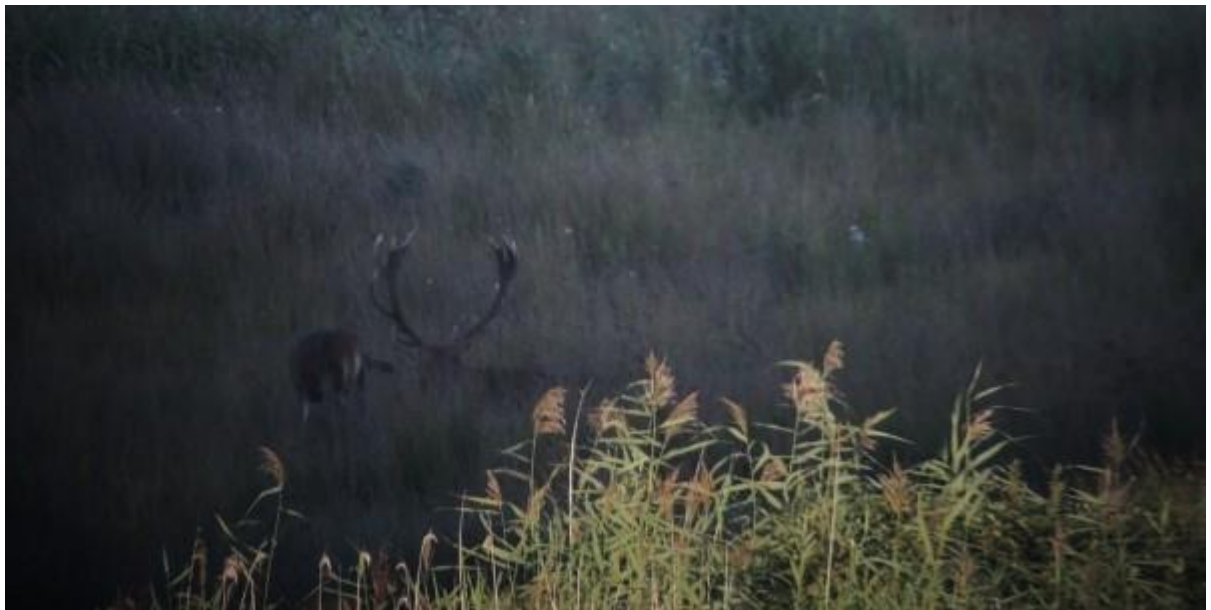
Zagen we mijheer lui liggen in het gras muisstil!